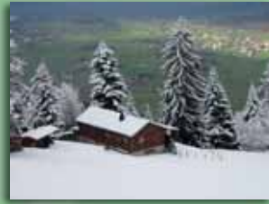
Skihaus 1050 m ü. M.