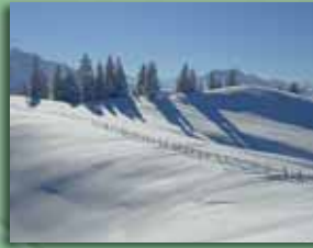
Lauihöhe 1455 m ü. M.