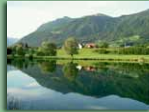
Hirschensee 410 m ü. M.