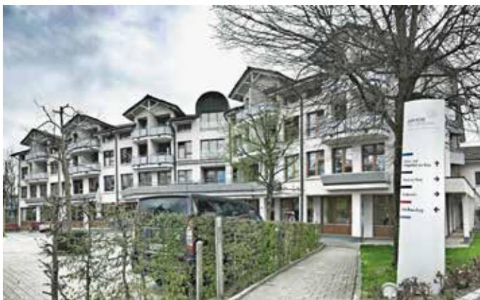
Alterszentrum zur Rose

Ein professionelles und motiviertes Team sorgt an 365 Tagen dafür, dass die Bewohnerinnen und Bewohner vollumfänglich versorgt sind. Neben der ganzheitlichen Pflege, Betreuung, Aktivierung und Alltagsgestaltung leisten auch die Gastronomie, Hauswirtschaft, Administration und der Technische Dienst täglich einen wertvollen und wichtigen Beitrag an ein umfangreiches Dienstleistungsangebot unter einem Dach.