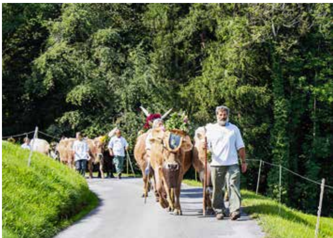
Impression der Alpabfahrt in Reichenburg