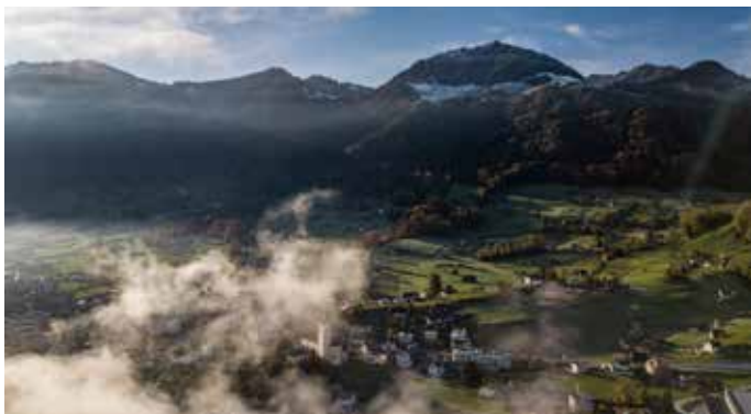
Dorf Reichenburg mit Kistleralp und Austock

Nähere Auskünfte erteilt Ihnen gerne der Einwohner- und Verkehrsver- ein Reichenburg, www.evreichenburg.ch