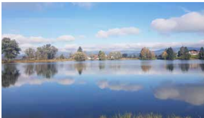
Der Hirschenweiher ist gut 300m lang und 250m breit