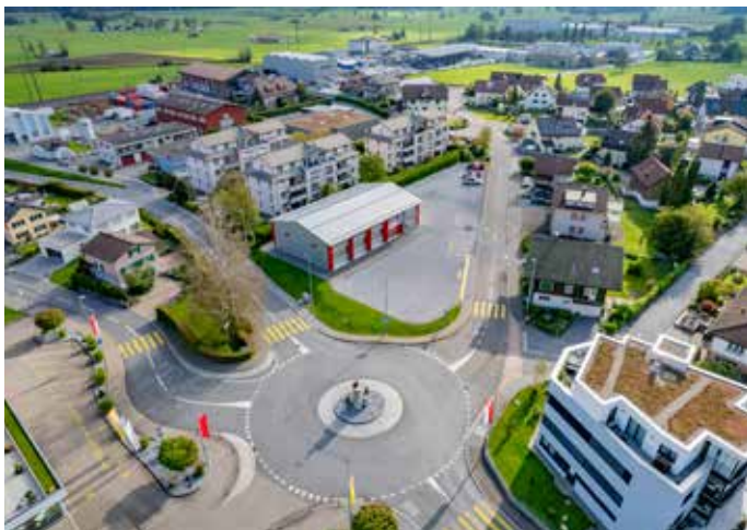
Kreisel Mooswies in Richtung Vogtswis