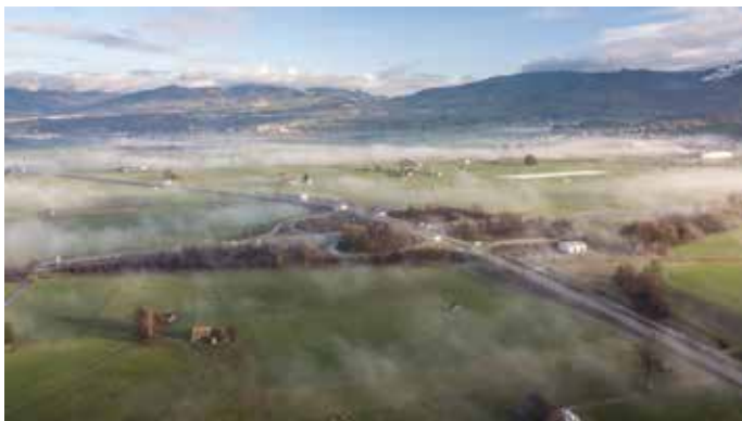
Direkter Autobahnanschluss an A3/A53