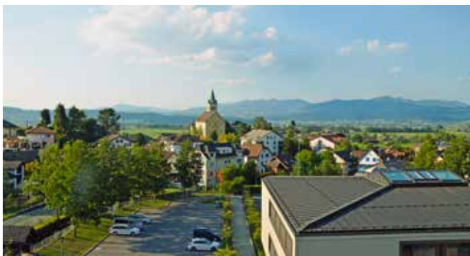
Dorfzentrum mit Kirche