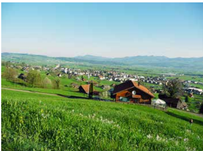
Blick vom Standort Füchslen in nordwestliche Richtung auf Reichenburg