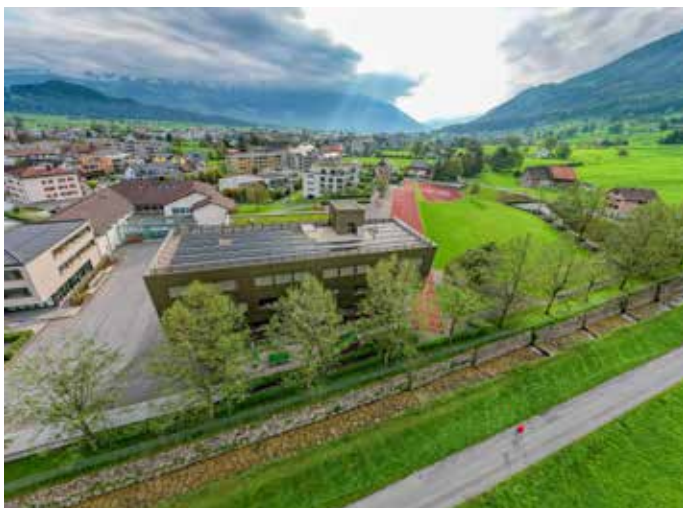
Schulhausareal Am Bach