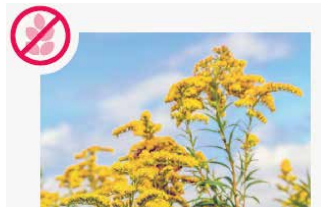
Amerikanische Goldruten Solidago canadensis