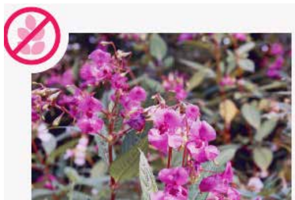
Drüsiges Springkraut Impatiens glandulifera