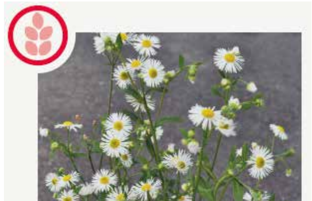
Einjähriges Berufkraut Erigeron annuus