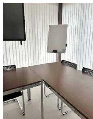
Freie Plätze in Kommissionen/ Wahlbüro

Infos zu Kommissionsaufgaben finden sie auch auf unserer Webseite: