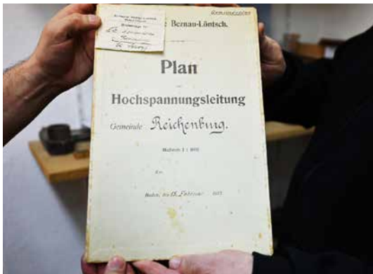
Erster Plan mit Hochspannungsleitung aus dem Jahr 1913.

Da staunt nicht nur der Laie, auch gelernte Stromer und Ingenieure kommen ins Schwärmen, wenn sie den Raum betreten. Die kleine, ehemalige Trafostation an der Benknerstrasse in Reichenburg birgt ein Fundus an Stromzählern, Glühbirnen, Werkzeugen, Sicherungen, Haarföhne und vieles mehr, das Strom benötigt. Plakate künden von ehemaligen Abstimmungskämpfen oder weisen auf den Tag der offenen EW-Türen hin. Die Sammlung bietet einen spannenden geschichtlichen Einblick in die Elektrifizierung der Region. Man erfährt beispielsweise, dass Reichenburg neben Lachen die erste Gemeinde mit einer Strassenbeleuchtung war.