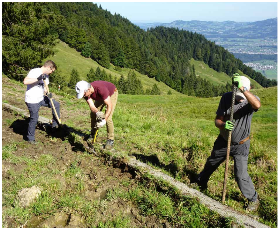
Begradigung eines bestehenden Baumstammweges im feuchten Gelände.

So hat der Verein in den letzten Jahren viel geleistet. Die Feuerstelle im Gwerderwald konnte zusammen mit der Allgemeine Genossame Reichenburg (AGR) renoviert und ausgebaut werden. Neben neuen Holzbänken, konnte auch ein Anbau an die Holzhütte, ein Trinkwasseranschluss und eine Chemietoilette angebracht werden.