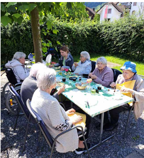
Grill-Zmittag für unsere Bewohner.

Unser Rosen-Café ist täglich geöffnet. Für ein Mittagessen ist eine Reservation bis 10.00 Uhr erwünscht. Die aktuellen Menüs finden Sie auf unserer Webseite.