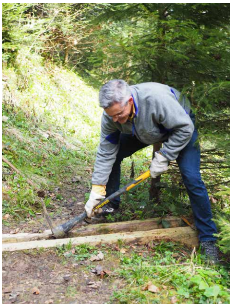
Reinigung der Wasserabläufe.