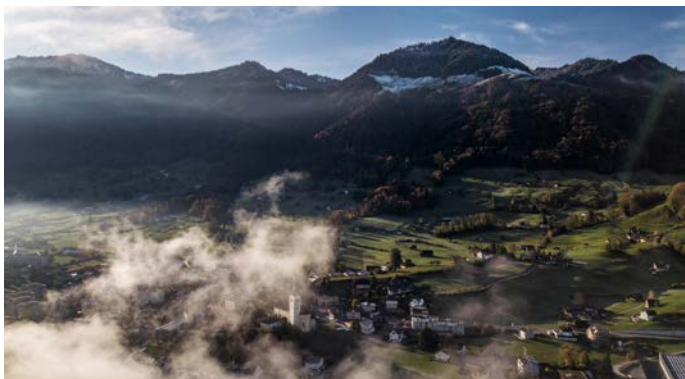
Dorf Reichenburg mit Kistleralp und Austock