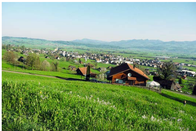
Blick vom Standort Füchslen in nordwestliche Richtung auf Reichenburg

Kontaktadresse: Obertaletenstrasse 7, Reichenburg