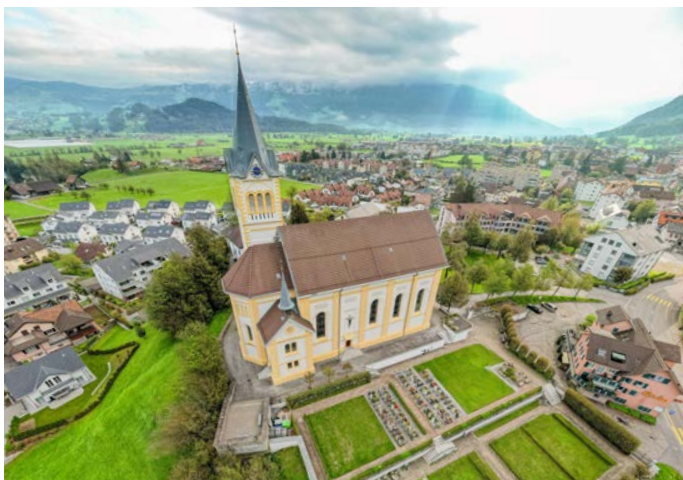
Katholische Kirche Reichenburg