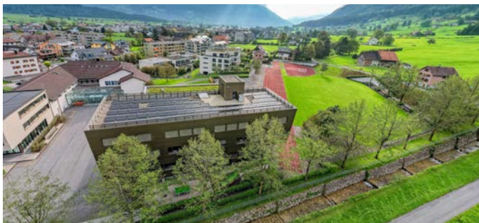
Schulhausareal Am Bach