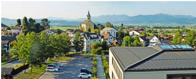
Dorfzentrum mit Kirche

Weitere Informationen erteilt Ihnen gerne das Einwohneramt.