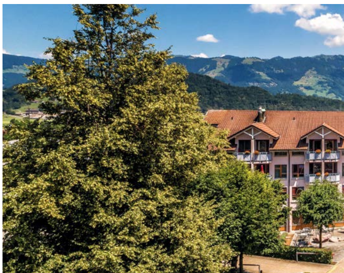
Alterszentrum zur Rose

Das Rosen-Café ist ein beliebter Treffpunkt für alle aus der Gemeinde und natürlich auch für alle auswärtigen Besucher und Gäste. Der Küchenchef legt grossen Wert auf einheimische und saisonale Produkte und es wird jeden Tag frisch gekocht. Es besteht immer die Möglichkeit, auf Reservation im Rosen-Café zusammen zu essen oder einen Geburtstag zu feiern.