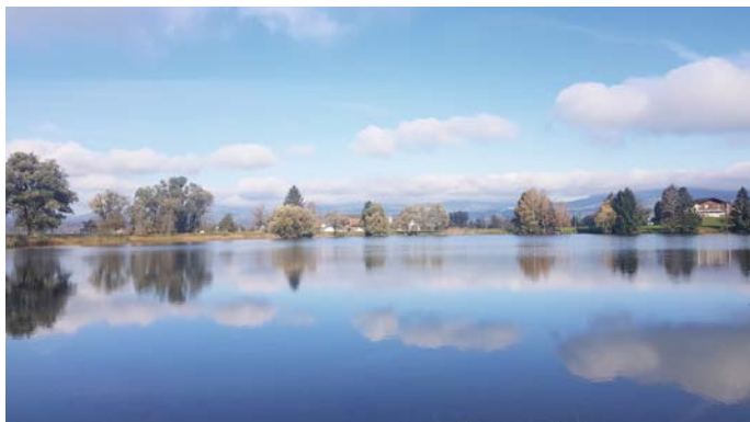
Der Hirschenweiher ist gut 300m lang und 250m breit.