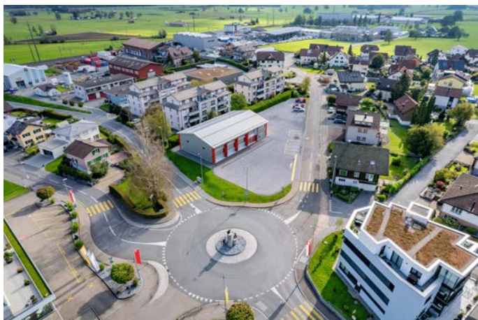
Kreisel Mooswies in Richtung Vogtswis

Für den täglichen sowie den Wochenbedarf steht im Dorf ein vielfältiges Angebot an Einkaufsmöglichkeiten zur Verfügung. Da werden Sie bestimmt fündig. Sei es in einem der typischen Dorfläden oder bei einem der zwei ansässigen Grossverteiler. Das örtliche Gewerbe freut sich auf Ihren Besuch.