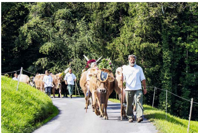
Impression der Alpabfahrt in Reichenburg