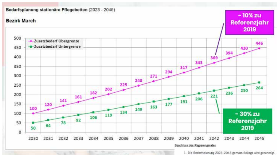
Zusatzbedarf an stationären Pflegebetten (Bezirk March, 2030–2045; Unter- und Obergrenze).

Die demografische Entwicklung führt in den kommenden Jahren zu einem markanten Anstieg der hochbetagten Bevölkerung in der March. Bereits heute sind die Alters- und Pflegeheime weitgehend ausgelastet. Ohne neue Lösungsansätze müssten bis 2040 bis zu 446 zusätzliche stationäre Pflegebetten geschaffen werden.