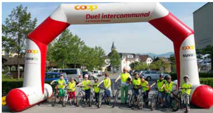
Mitmachen kommt vor dem Rang