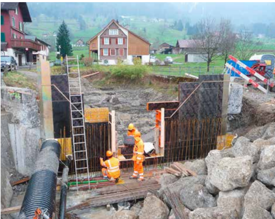
Auslaufbauwerk Kiessammler Hofstrasse

Die Bauarbeiten am Hogglibach neigen sich dem Ende entgegen. Auch die Erstellung des Auslaufbauwerks beim Kiessammler ist beendet und seit Anfang April fliesst das bergseits anfallende Wasser in den neu ausgebauten Bach. Dadurch kann der Schäflibach massgebend entlastet werden. Die bestehende Verbindungsleitung zwischen dem Hogglibach und dem Schäflibach wird beim Kiessammler verschlossen, bleibt aber in ihrem Bestand vorerst erhalten um sie bei Bedarf weiterhin nutzen zu können.