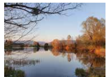
Bis im Herbst 2021 könnte es so weit sein, dass über eine Badi Hirschlensee abgestimmt wird.

Bis die ersten Badi-Besucher mit offizieller Erlaubnis im Hirschlensee ihre Runden drehen, wird es also doch noch einige Zeit dauern. Land ist indes in Sicht, dass der Wunsch nach einem geregelten Badebetrieb doch noch Realität wird.