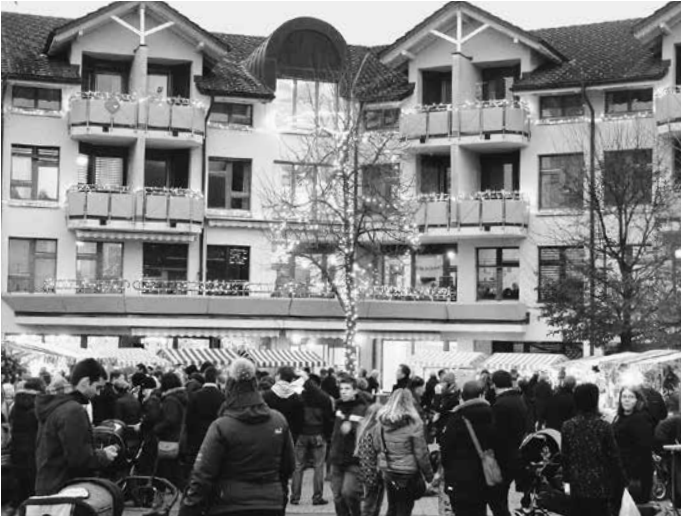
Chlausmärt trifft Weihnachtsbummel