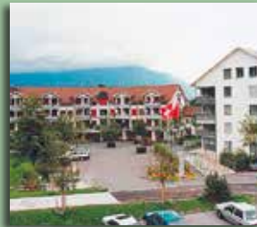
Alterszentrum «zur Rose»