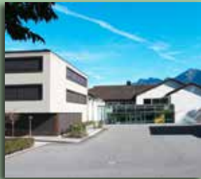
Mehrzweckareal (Schulhaus, Gemeindeverwaltung)